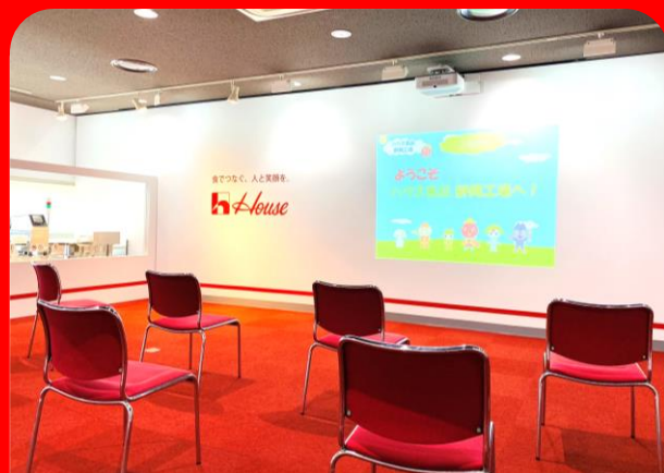
映像観覧スペース